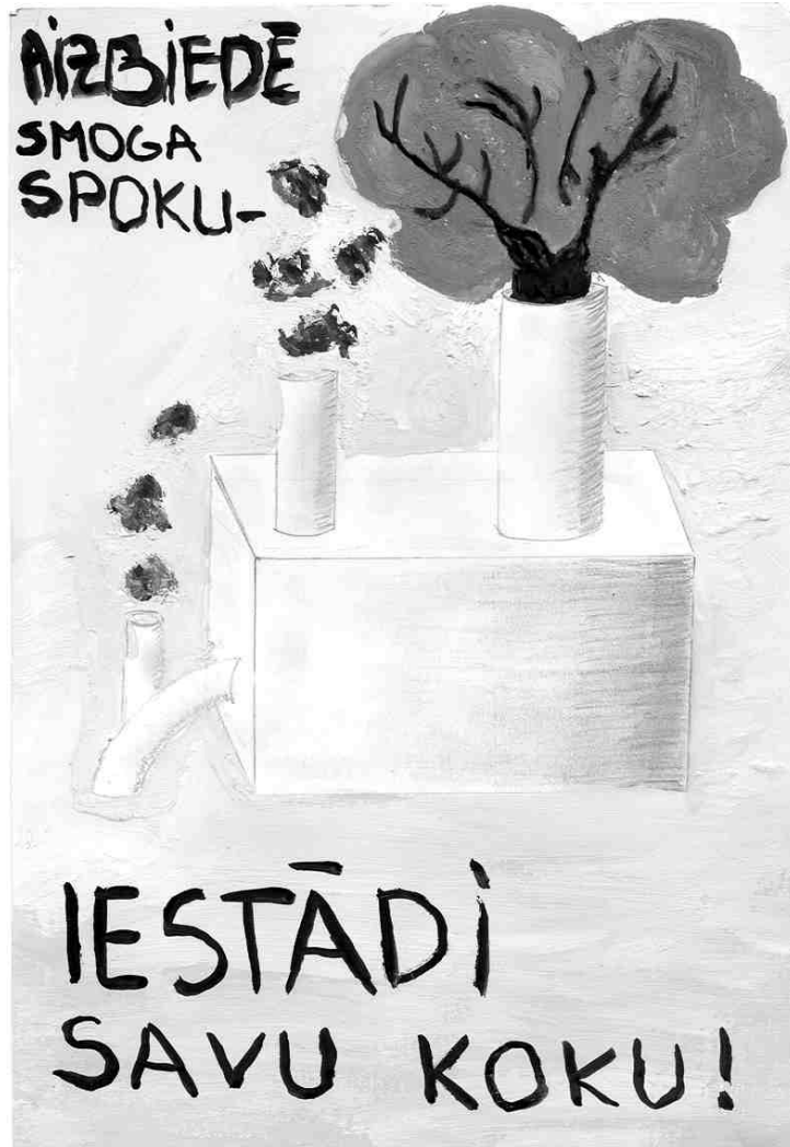
Elīnas Kļavenieces zīmētais plakāts tiks izvietots vides stendos visās lielākajās Latvijas pilsētās.