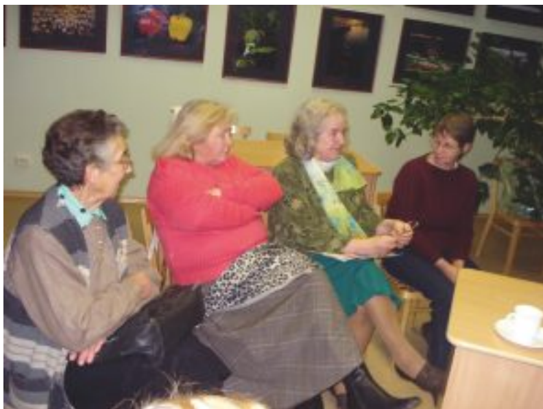
Krēslas stundas dalībnieces Edvarta Virzas Iecavas bibliotēkā dalījās iespaidos par Norvēģiju un Zviedriju.