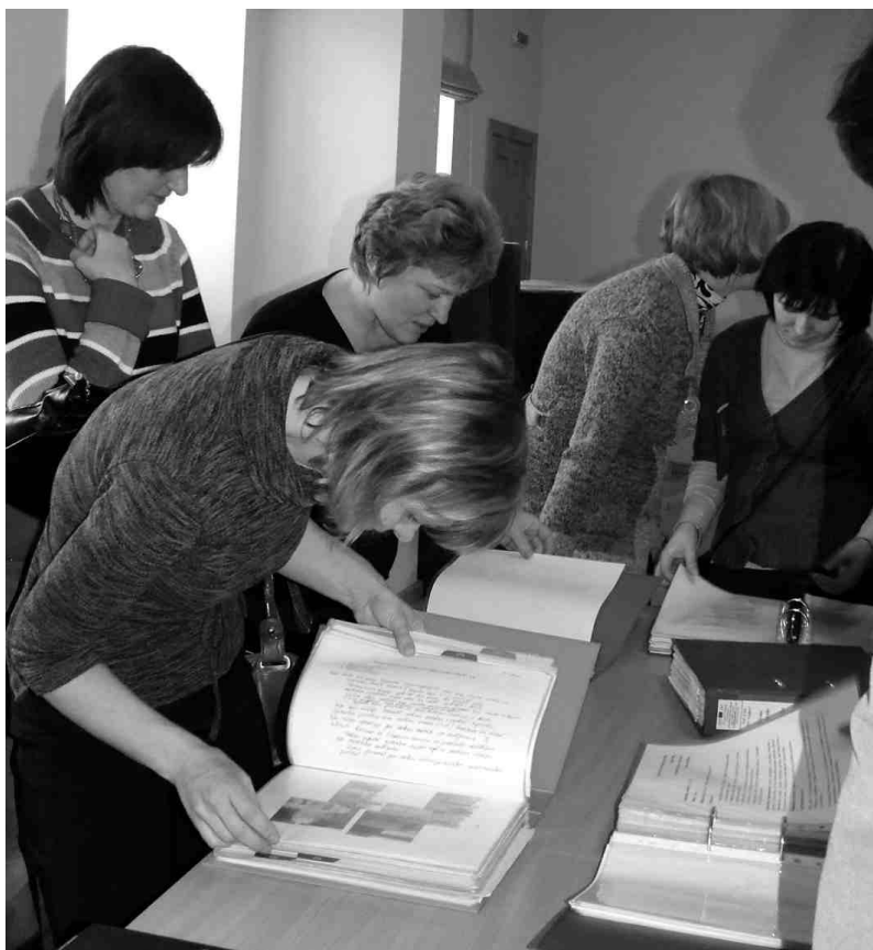
Sanākušie pedagogi ar lielu interesi apskatīja portfolio izstādi un iepazīna kolēģu līdzšinējo veikumu iepriekšējos posmos.