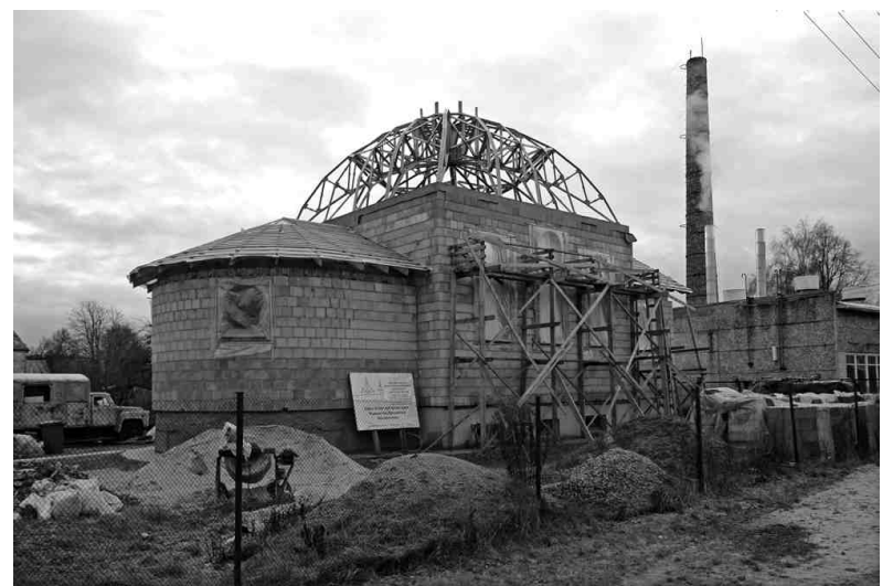
Celtniecības konstrukcijas jau iezīmē topošā dievnama aprises. Baznīca top, pateicoties ziedojumiem un cilvēku brīvprātīgajam darbam.