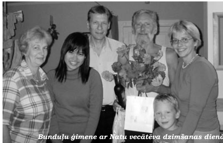
Bunduļu ģimene ar Natu vecāteva dzimšanas dienā

Lai kļūtu par viesģimeni, jāsaazinās ar YFU Latvijā, zvanot pa tālruni 67212025 vai rakstot uz e-pastu zane@yfu.lv. IZ