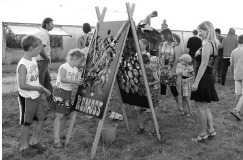
Spēļu un sporta aktivitātēs iesaistījās visu vecumu bērni un jaunieši.