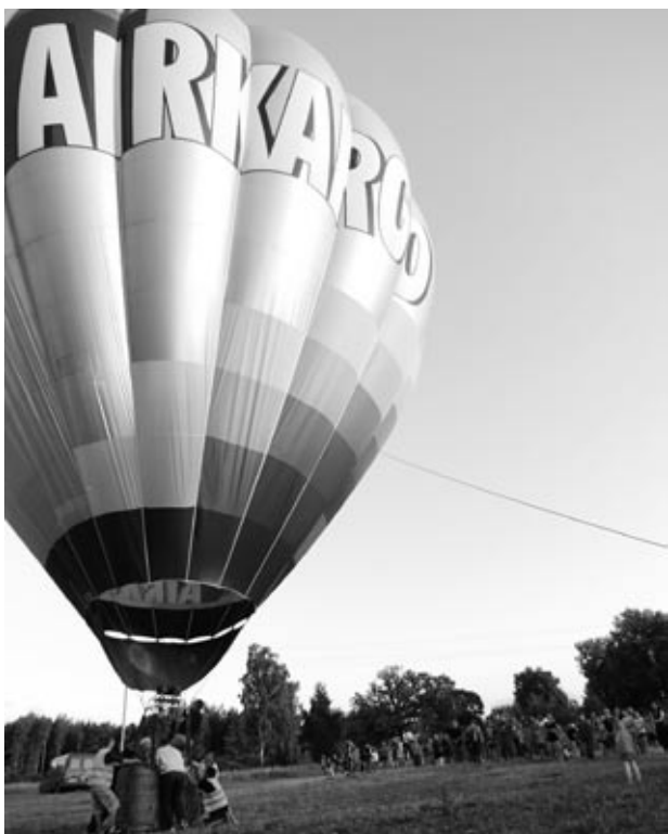
Balons beidzot paceļas debesīs.