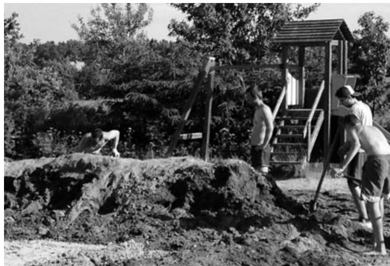
Laukuma būvniecībā aktīvi iesaistījušies arī citi Dimzukulna iedzīvotāji.