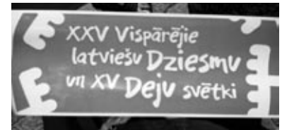
Svētku noskaņas bija manāmas arī uz sarkanbaltās nožogojuma lentas.