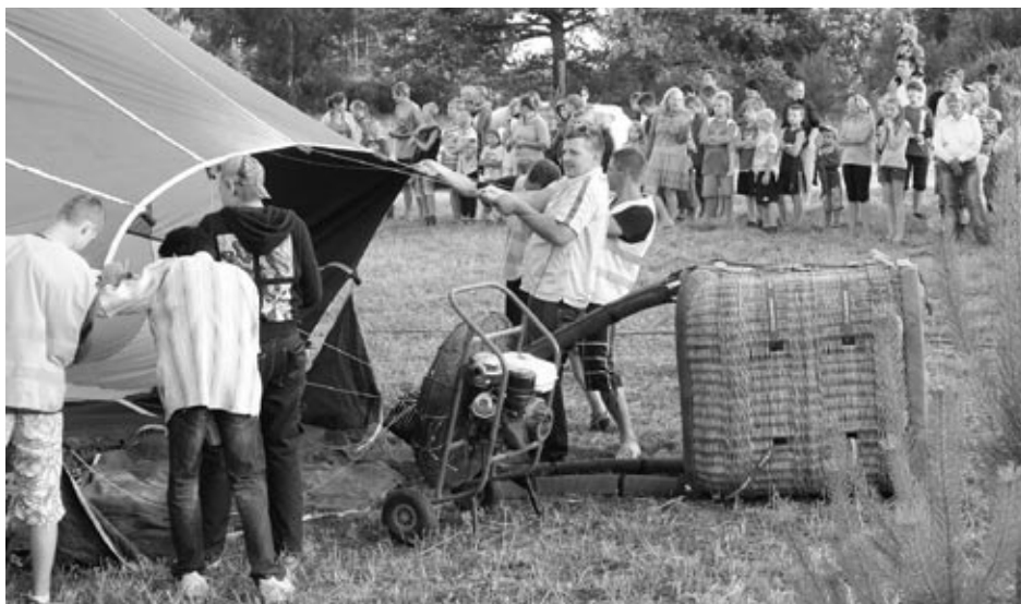
Bērni ar aizrautību vēroja gaisa balona pacelšanas procesu.