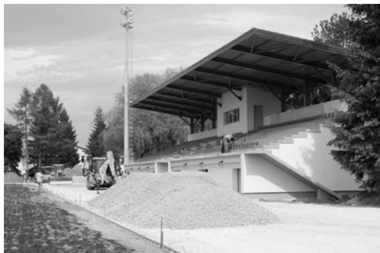
Tribīnēs zem nojumes būs sēdvietas vairāk kā 400 skatītājiem.

Stadionā tribiņu celtniecība jau ir pabeigta. Zem tām izbū-