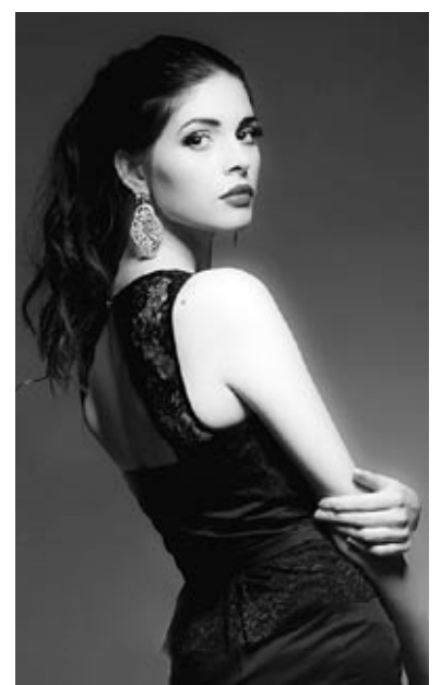
Fotosesija tirdzniecības centra «Galerija Centrs» modes blogam.