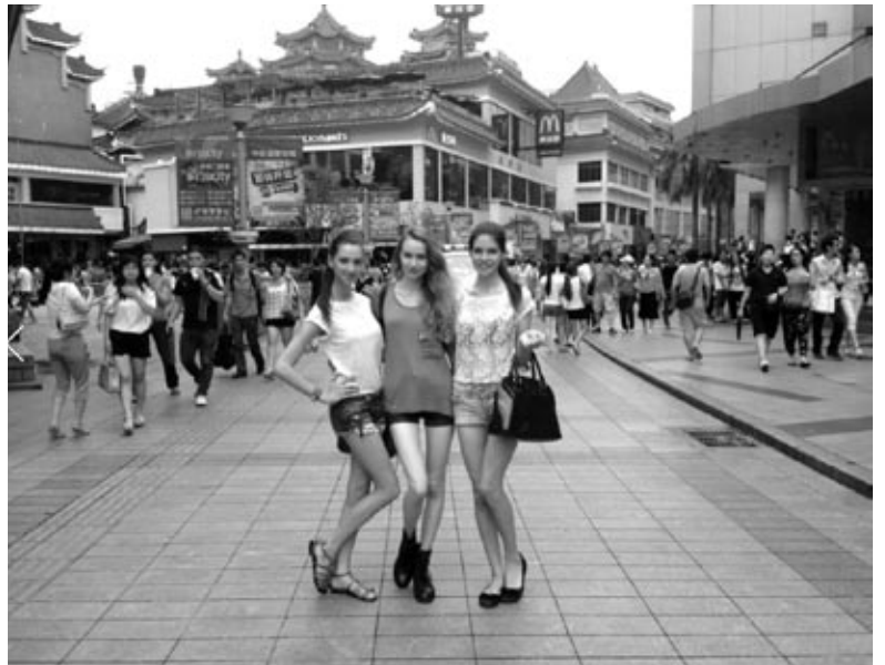
Kopā ar meitenēm no Polijas un Ungārijas Šeņdžeņā.

«Modeļu bizness piespiež sevi uzturēt formā – augumu, seju, matus, rokas, taču tajā pašā laikā tos arī sabojā. Piemēram, matus, jo tos nākas bieži veidot. Es nesportoju un nekādas diētas neievēroju. Laikam tādi gēni – no tēta. Šād tad pavingroju, paskrienu savam priekam. Pārtikā cenšos izmantot veselīgus produktus, jo tie ir labi ne tikai modes skatēm, bet arī sejai un matiem ikdienā. Katru dienu dzeru citronūdeni, ēdu dārzeņus un gaļu. Protams, ka mēdzu sevi palutināt arī ar saldumiem. Zinu, ka Parīzē ir pieprasītas ļoti tievas modeles, bet es sevi