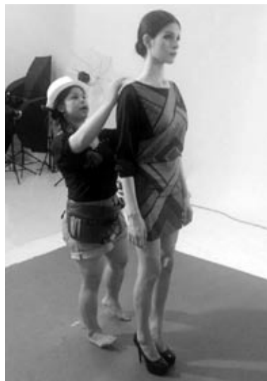
Modeles darba ikdiena Ķīnā...

nespīdzinātu. Mani apmierina mans tagadējais izskats. Ķīnā bija tik karsts – katru dienu vairāk par 30 grādiem, ka ēst negribējās. Biežāk ēdām rīsus, taču man bija izdevība pagaršot arī astoņkājus, japāņu nūdeles, kalmārus, dažādas zivis un jūras zāles, tofu un Ķīnas maizi, kas garšo pēc alus. Maize, piens un siers gan Ķīnā ir dārgi.»