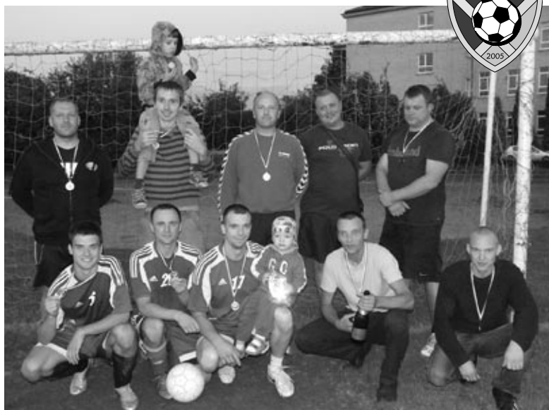
Turnīra čempioni - komanda Santos.