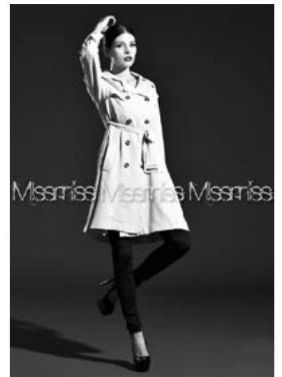
...un arī rezultāts apģērbu katalogā.