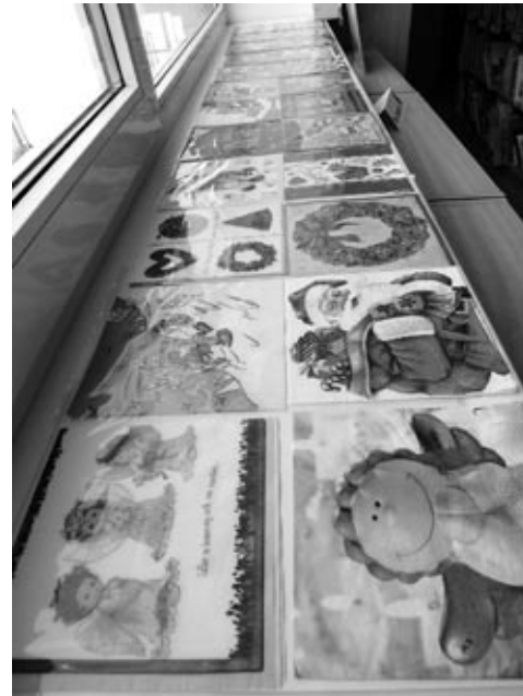
Salvešu krāsainie Ziemassvētku rūķi satupuši uz bērnu bibliotēkas palodžēm.