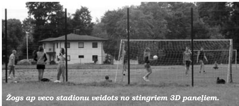
Žogs ap veco stadionu veidots no stingriem 3D paneļiem.

Žoga izbūvi finansēja Iecavas novada pašvaldība, no budžeta šim mērķim tērējot Ls 3486,49. IZ