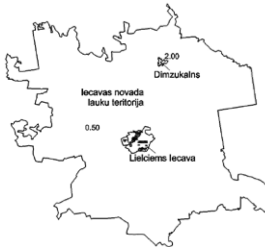
Iecavas novada dzīvojamo māju apbūves vērtību zonas 2014. gadā, individuālās apbūves zemes bāzes vērtības Ls/m².

Plašāku informāciju par kadastrālo vērtēšanu var lasīt specializētajā mājas lapā www.kadastralavertiba.lv , kā arī informatīvajā bukletā «Īpašuma kadastrālā vērtība», kas pieejams VZD klientu apkalpošanas centros visā Latvijā. IZ