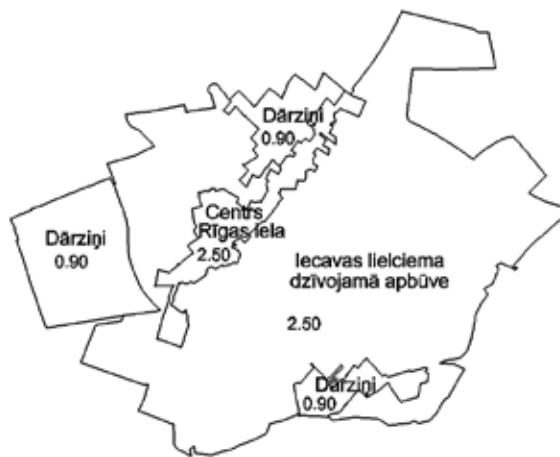
Iecavas novada lielciema dzīvojamo māju apbūves vērtību zonas 2014. gadā, individuālās apbūves zemes bāzes vērtības Ls/m².