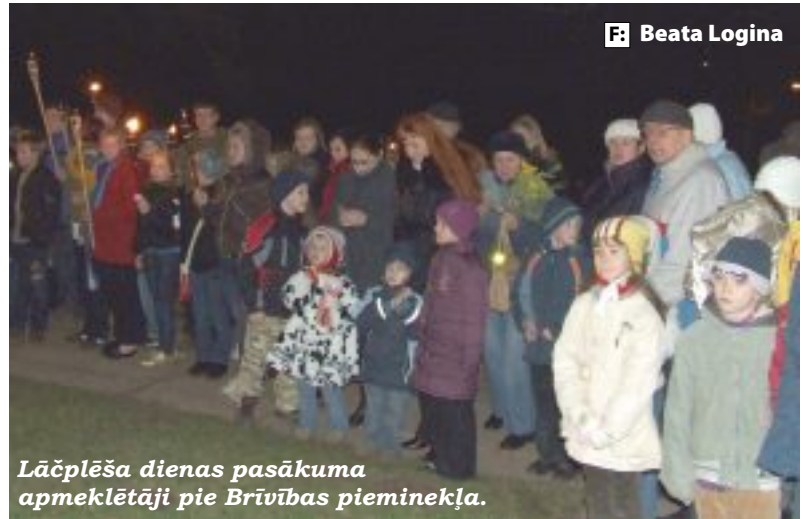
Lāčplēša dienas pasākuma apmeklētāji pie Brīvības pieminekļa.