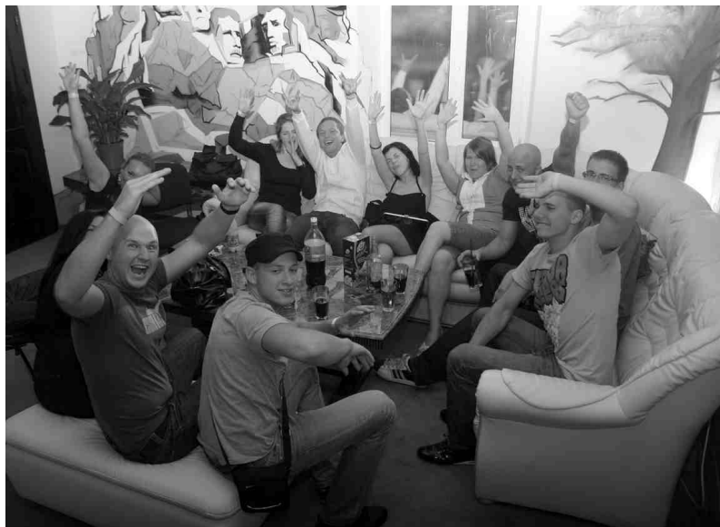
White House tauta atbrīvotā garā.