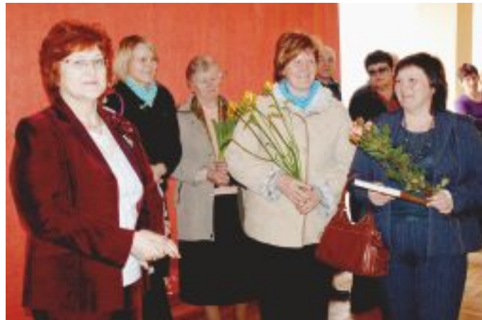
Izstādes atklāšanā darbu autori (no kreisās) kuplā pulkā sveica radi, draugi un kolēģi.